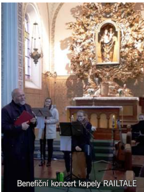
Benefiční koncert kapely RAILTALE