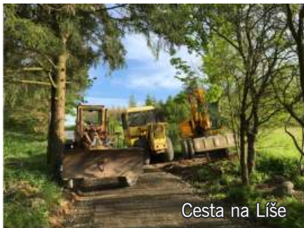
Cesta na Líše