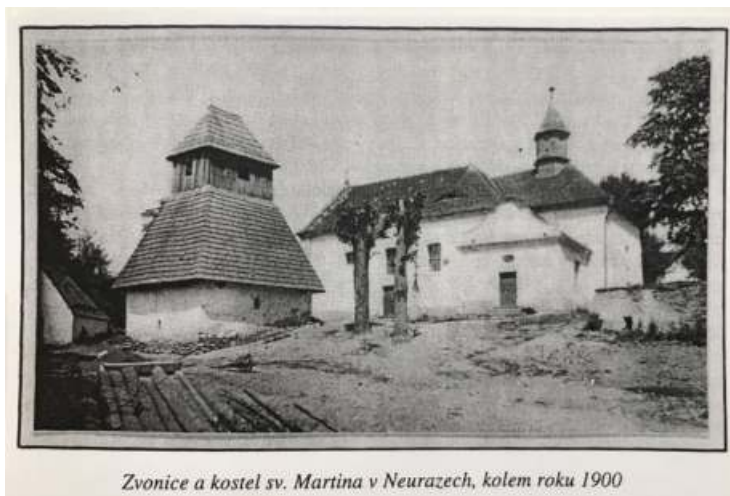
Zvonice a kostel sv. Martina v Neurazech, kolem roku 1900

Další zajímavé vyprávění přináší https://neurazy.cz/neurazy/trochu-historie/a-berndorf-povest-o-kakovskem-hradu-a-jeho-podivnem-zaniku/