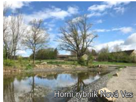
Horní rybník Nová Ves