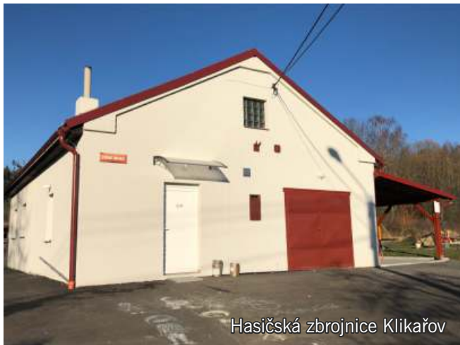
Hasičská zbrojnice Klikařov

dětské hřiště u hasičské zbrojnice (dotace ČEZ) přístavba k hasičské zbrojnici Klikařov stavba pergoly oprava místní komunikace v oblasti mostu