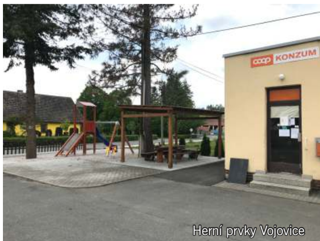
Herní prvky Vojovice

oprava požární nádrže odbahnění rybníku Vlčice oprava kapličky Vojovice (dotace) stavba přístřešku u obchodu instalace herních prvků přístavba k hasičské zbrojnici získání dotací na podporu místních prodejen COOP