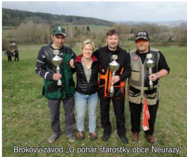
Brokový závod „O pohár starostky obce Neurazy“

záštitou SDH. Kulinářské umění tradičně předvádějí na svých akcích Sestry v akci z Radochov. Lampionový průvod Radochovy. Akce pionýrského oddílu Babeta Neurazy přináší dětem sportovní i společenské vyžití. Velké návštěvnosti se těší lampionový průvod a do povědomí se dostává i sportovní soutěž v cyklobiatlonu – Velká neurazská. Dále se Babety zapojují do celorepublikové akce Uklidme Česko a dobrovolnického projektu 72 hodin.