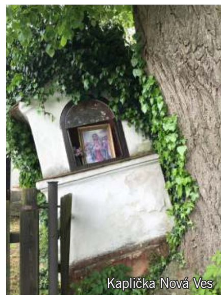
Kaplička Nová Ves