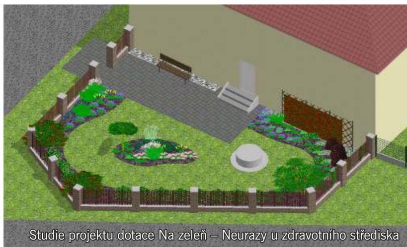
Studie projektu dotace Na zeleň – Neurazy u zdravotního střediska

a/ sportovní víceúčelové hřiště Neurazy (dotace) b/ cesta od nádrže na Cikánku Neurazy c/ oprava cesty k rybníku Rousovák d/ projekt GEOPORTAL (financování prostřednictvím dotace) e/ instalace dřevěného altánu u herních prvků Neurazy (dotace) f/ zapojení se do projektu dotace Na zeleň