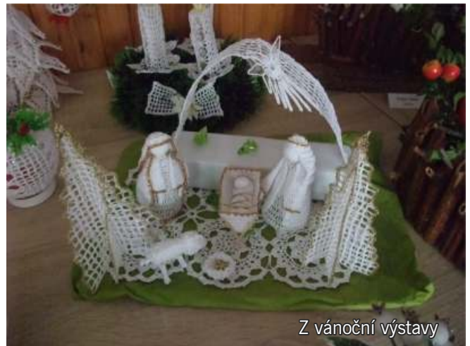
Z vánoční výstavy