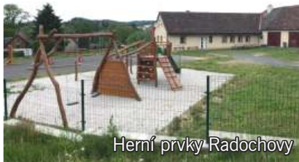
Herní prvky Radochovy