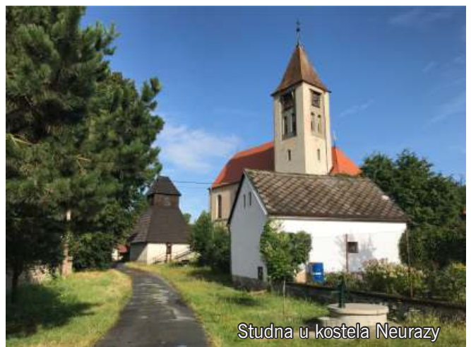
Studna u kostela Neurazy

herní a cvičební prvky (dotace) oprava schodů a studně u kostela sv. Martina rekonstrukce obecního bytu u Martinské hospody oprava cesty na Líše odbahnění rybníku Rousovák oprava studně na Cikánce zakoupení kontejneru na hřbitovní odpad úprava okolí a parkovacích míst u MŠ